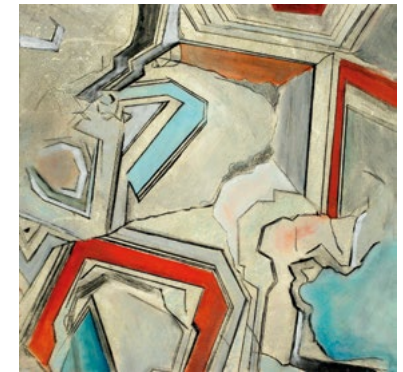
Fra serien Geotrykk // From the serie Geoprint

In the summers of 2003 and 2004, Mæhlum participated in a geological scientific expedition to Svalbard. The impressions resulted in the “Geoprint” series. Based on sketches and various photographic material, Mæhlum depicts geological shapes and patterns, partly observed with the naked eye and partly with an electron microscope, on plates that se prints in intaglio technique. The plates are made of plastic and metal and have a grainy structure where the shapes are partly further accentuated with drypoint. In 2007, Mæhlum concluded her work on “Geoprint”. Her interest in nature’s microstructures continued, however, through collaboration with marine biologists she met in Ny-Ålesund on Svalbard. The object of study was plankton. Based on the scientists’