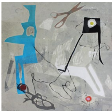
Fra serien // From the serie Ladybag

av billedflaten, dels i fargetette og dels i transparente partier. I «Ladybag» tok hun i bruk pvc-sjabloner kombinert med etsninger av store sinkplater. Begge seriene er figurative, med gjenkjennelige skikkelser og ting; «Fabler» innen et poetisk, surrealistisk billed-